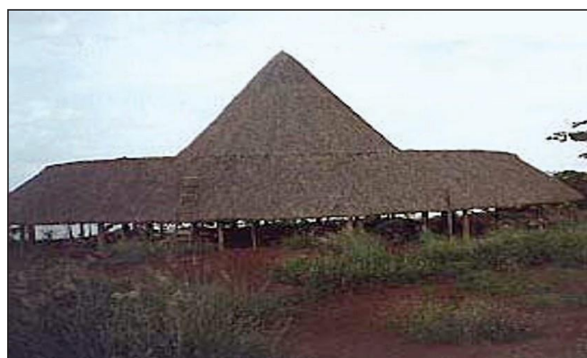
Edificação de madeira com cobertura de fibras vegetais

5.2.1 As fontes de calor que podem inflamar as fibras combustíveis devem ser isoladas e mantidas à distância, mínima, de 5 m.