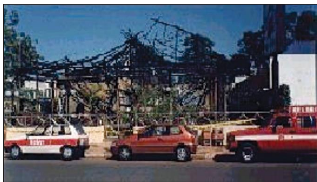
Incêndio em edificação com cobertura de fibras vegetais (ocupação de bar e restaurante)

5.5.4 Recomenda-se a utilização de sistemas de aspersão de água que visam a manter as fibras permanentemente úmidas ou destinadas ao próprio combate das chamas, sem prejuízo das demais medidas constantes desta IT.